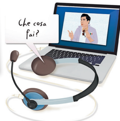
Seite 51 Sprachen lernen Parla italiano? Nein? Mit Handy, Tablet oder Laptop lernt man fremde Sprachen viel schneller