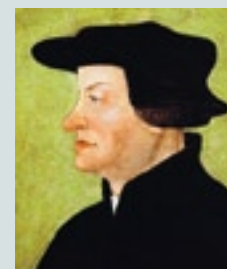
Gesucht wurde der Zürcher Reformator Huldrych Zwingli (1484-1531).