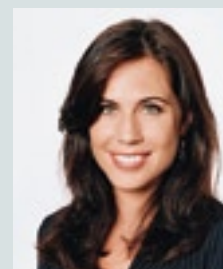
Gesucht wurde die TV-Moderatorin und Redaktorin Susanne Wille .