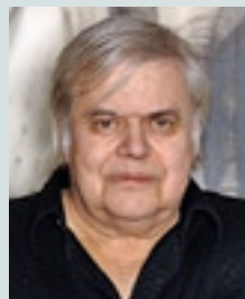
Gesucht wurde der Maler und bildende Künstler Hansruedi Giger.