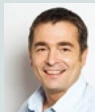
Gesucht wurde der Schauspieler Stefan Gubser.