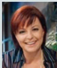
Gesucht wurde die Fernsehmoderatorin Monika Fasnacht .