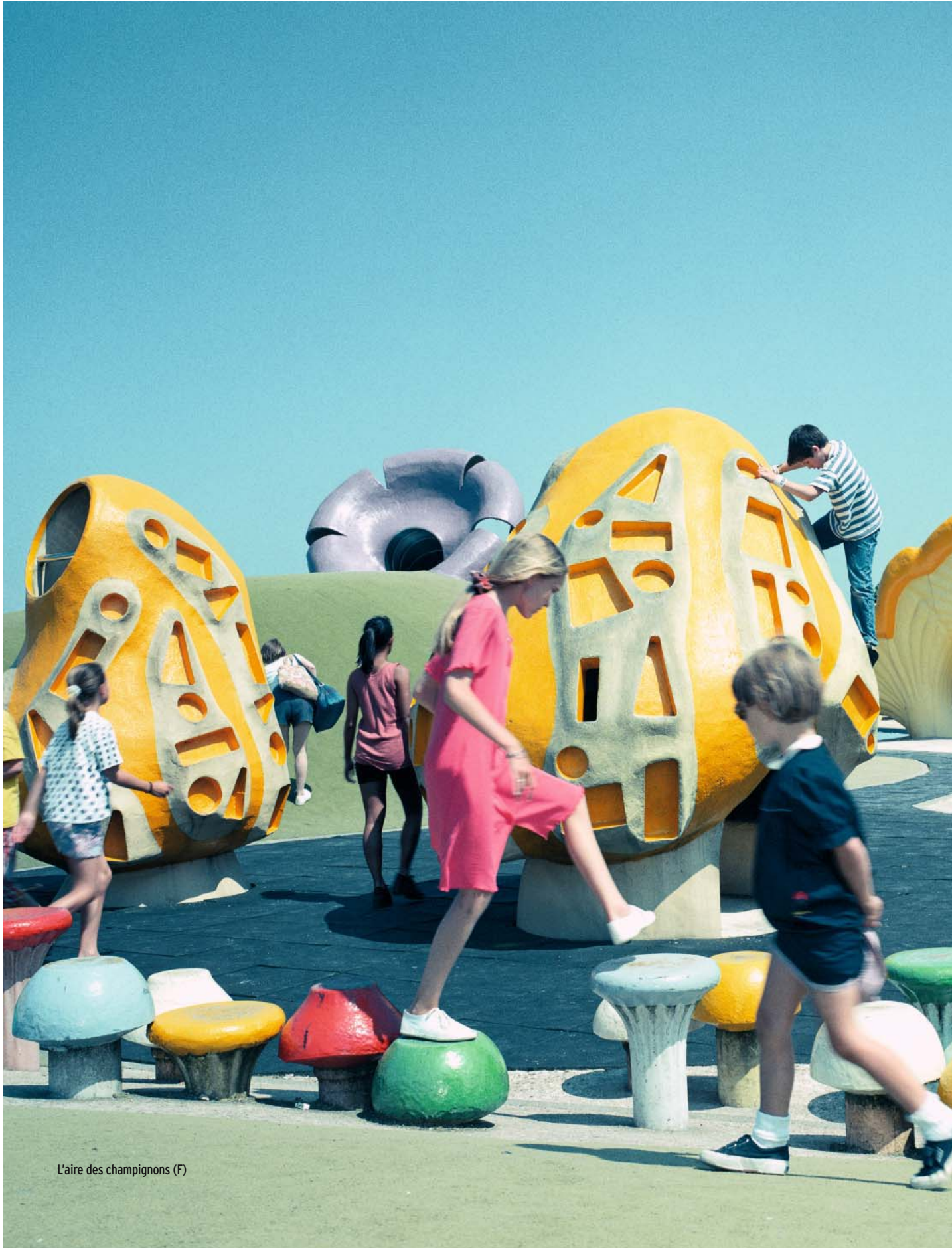
L'aire des champignons (F)