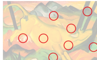
Auflösung aus Heft Nr. 23

Finden Sie die 8 Unterschiede: Mit neun Gemälden bannte der Venezianer Vittore Carpaccio (1465 bis 1525/26) die «Legende der Hl. Ursula» auf die Leinwand. Als drittes Bild des Zyklus malte der Meister der Frührenaissance die «Rückkehr der Gesandten in die Heimat» (Original oben).