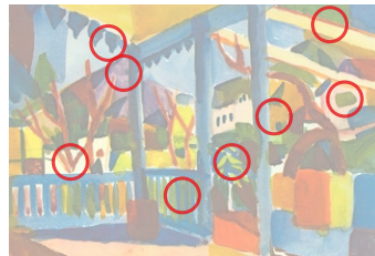
Auflösung aus Heft Nr. 14

Das Werk «Étude pour la ville» (Original oben) malte Robert Delaunay (1885 bis 1941) um 1909. Delaunay zählte zur französischen Avantgarde, hatte als Bühnen- und Dekorationsmaler begonnen und gehörte der legendären Künstlervereinigung Der Blaue Reiter an.