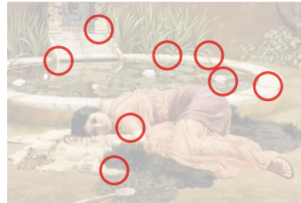
Auflösung aus Heft Nr. 22

Finden Sie die 8 Unterschiede. Das Gemälde «Goethe in der Campagna» (Original oben) von Johann Heinrich Wilhelm Tischbein (1751 bis 1829) entstand auf einer Italienreise, die Goethe und Tischbein teils gemeinsam unternahmen. Goethes Reisebericht erschien 1816 und 1817 in zwei Teilen.