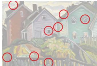
Auflösung aus Heft Nr. 13

Der armenische Maler Arshile Gorky (1904 bis 1948) verlor im Genozid fast seine ganze Familie. Mit einer Schwester flüchtete er als 16-Jähriger nach New York. Mit Werken wie «Untitled» von 1944 (Original oben) gilt er als Pionier des abstrakten Expressionismus.