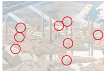
Auflösung aus Heft Nr. 17

Der Nahe Osten war dem Italiener Alberto Pasini (1826 bis 1899) Inspiration für seine Werke. Erstmals bereiste er die Region, als er 1855 den Maler Théodore Chassériau als offiziellen Künstler in Persien ablöste. Die Moschee (Original oben) malte er 1886.