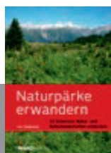
Luc Hagmann Naturpärke erwandern – 22 Schweizer Natur- und Kulturlandschaften entdecken

Lange hatte die Schweiz nur den Nationalpark im Engadin. Dann entstanden innert kürzester Zeit ein Dutzend neuer Naturpärke. Zählt man die UNESCO-Gebiete zur Parklandschaft Schweiz, kommt man auf einen Drittel der Landesfläche. Wandernde haben die Gelegenheit, auf dem dichten Wanderwegnetz die Naturpärke und UNESCO-Gebiete zu erkunden. Einige der in diesem Buch vorgestellten Touren ermöglichen ein erstes bequemes Parkschnuppern; andere möchten den für einen Park typischen Landschafts- und Kulturcharakter erlebbar machen. So unterschiedlich wie die Motive, so verschieden sind auch die Ansprüche an die Kondition: Von der einfachen Flusswanderung bis zur schwierigen Bergwanderung ist alles zu finden.