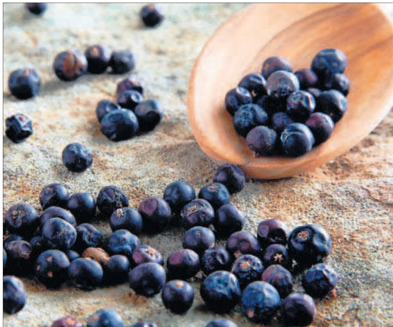
Wacholder-Beeren sind ein hervorragendes Hausmittelchen gegen grippale Infekte.

Kompetenz- und Bildungszentrum für Ganzheitsmedizin www.paramed.ch