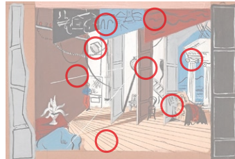
Auflösung aus Heft Nr. 19

Finden Sie die 8 Unterschiede. Die niederländische Malerin Jacoba van Heemskerck (1876 bis 1923) war regelmässig in der expressionistischen Zeitschrift «Der Sturm» vertreten. Ihre «Composition no. 62» (Original oben) wurde 1917 in Berlin gezeigt, zusammen mit Bildern etwa von Klee, Chagall, Marc.